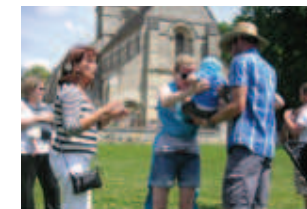
Extrait du texte de Bérengère Aronio

Une randonnée de 6 kms. entre Falvy et Villecourt a permis à près de 60 personnes de découvrir ces villages et s'initier au portage en écharpe avec démonstration par l'association ISIS. Une pose "musique" par l'harmonie de Nesle et une pose "conte" par Laurie Marchat ont animés cette randonnée.