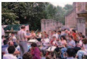
Concert/exposition de 1986

Ce premier numéro a été créé pour pouvoir rendre compte de l'activité de l'association, de l'activité municipale et des événements divers de la Commune en particulier des différents concerts, expositions, activités diverses etc.