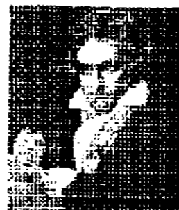
Ludwig van Beethoven compositeur allemand 1770 - 1827